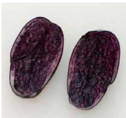
'Blue Congo' finns med på EU:s gemensamma sortlista. Sorten är en kuriositet med sin genomfärgade knöl, som även efter kokning är färgad.