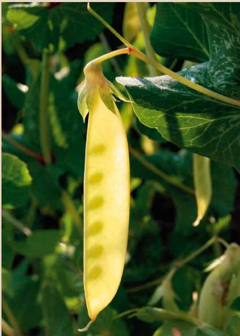
Vaxärten 'Märta' togs in på den svenska sortlistan 2011 som en amatörsort.

'Märta' är en sort av ärt ( Pisum sativum L.) med gula baljor. Blommorna är lila och skottspetsarna på växten är gulaktiga. Baljorna äts som sockerärter eftersom de saknar hinna. Sorter med gula baljor tillför något synligt till variationen av köksväxter. Den har odlats inom föreningen Sesam under minst 20 års tid och visat att den är väl anpassad till det svenska klimatet. Det saknas dock dokumentation om att sorten varit i odling före 1950, vilket klart skulle angett bevarandevärdet. Det är därför osäkert om den skulle kunna tas in på sortlistan som en bevarandesort i Sverige. 2011 togs den in som en amatörsort.