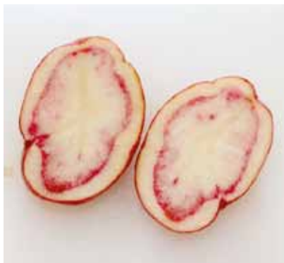
Genomskuren knöl av bevarandesorten 'Köttpotatis'. I sortbeskrivningen ska bl.a. knölens form och färg beskrivas i detalj.