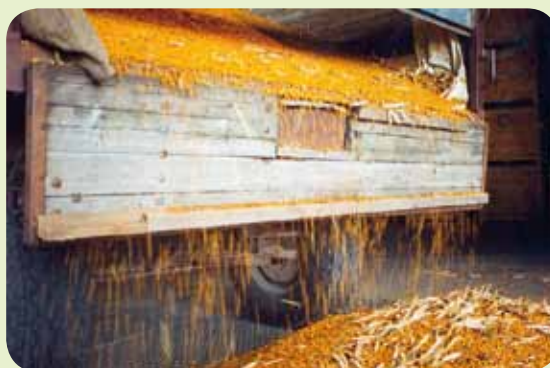
Lossning av nyskördade bruna bönor.