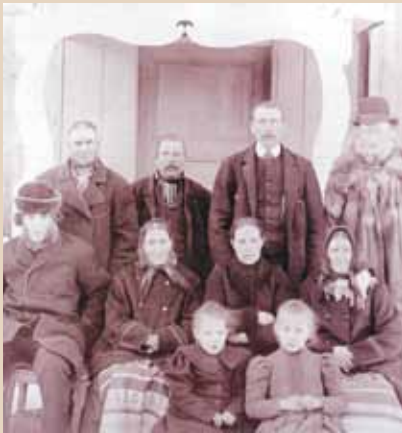
Ol-Ersa iförd hundpäls står längst upp till höger.