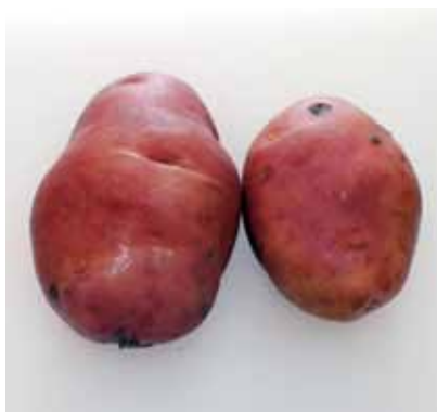
'Early Rose' har odlats allmänt Sverige, men härstammar från en fröplanta från Garnet Chili, USA, 1867.

Kålroten 'Östgöta II' togs fram på Weibullsholms växtförädlingsanstalt och introducerades i handeln 1936. Den är plattrund med grön nacke och gul undersida.