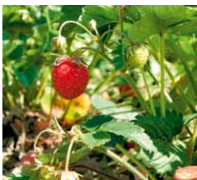
Smulgubben 'Rebecka' omfattas av svensk växtförädlarrätt till utgången av 2027. Det är SLU som är sortägare.