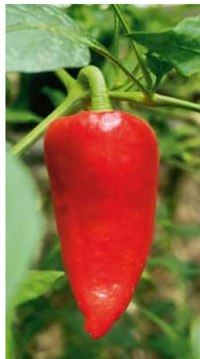
Chilipepparsorten 'Leutschauer' är upptagen på EG:s sortlista som amatörsort.

Stickprovskontroller av förpackningar kommer också att göras för att se att det är rätt sort. Utsädet ska stämma med sortbeskrivningen enligt ansökan och vid en odlingskontroll ska utsädet även stämma överens med motsvarande sort hos NordGen.