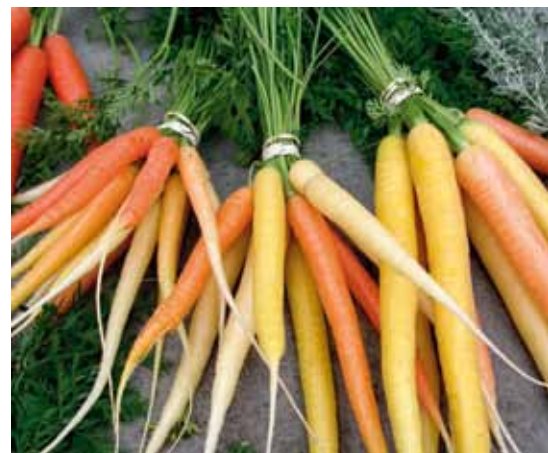
Variationen mellan olika sorters morötter är stor.

Undantaget gäller under vissa villkor och med vissa begränsningar. Har du en sort med stort kommersiellt värde bör ansökan om intagning på sortlistan göras som för en marknadssort för att undvika begränsningar avseende förpackningsstorlek eller odlad utsädesareal.