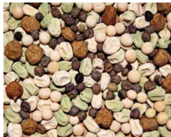
Blandade sorter av ärtor.