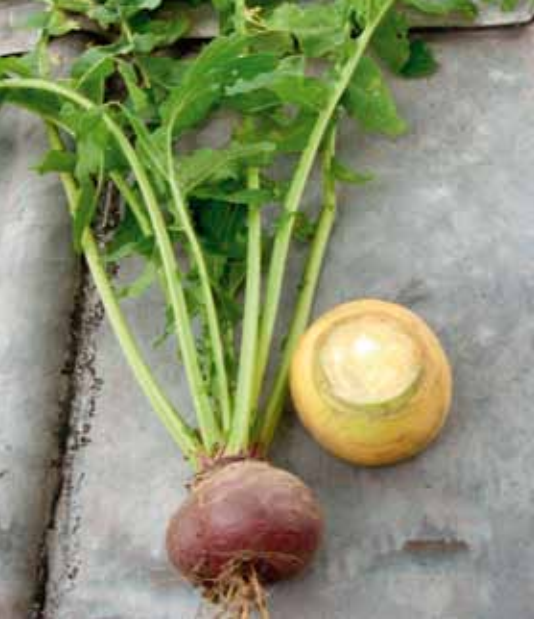
Skålrovan från Tännäs är gul eller lila i skalet. Undersidan på rovan är skålformad.