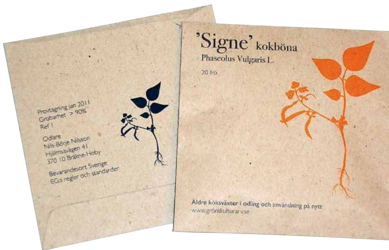
Exempel på märkning av fröpåse.

Utsäde av en bevarandesort kan certifieras, vilket innebär mer omfattande kvalitetsbedömningar av utsädet och mer kontroller av odlingen men som också ger en större trygghet för köparen av utsädet. I normalfallet kommer utsädet dock främst att säljas som standardutsäde vilket innebär grundläggande krav på utsädet som sortrenhet, en minsta grobarhet och att utsädet är friskt och rent. Utsäde av en amatörsort säljs alltid som standardutsäde.