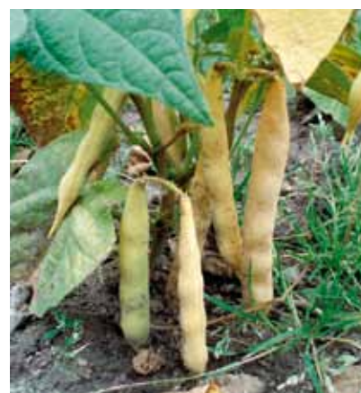
Buskbönan 'Signe' är upptagen som bevarandesort på svenska sortlistan. För att odla utsäde av sorten, måste du anmäla dig som utsädesodlare hos Jordbruksverket.