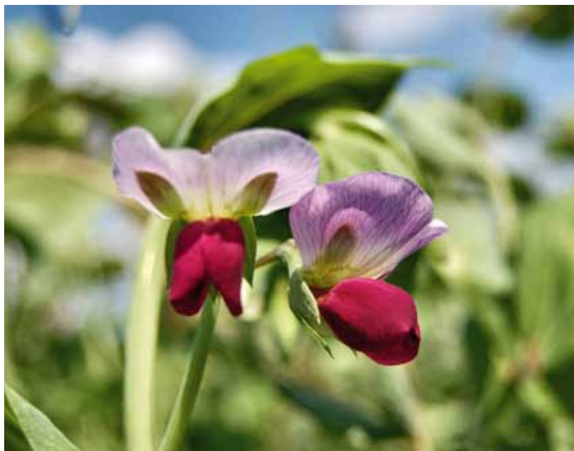
Märgärten 'Visingsö' togs in på sortlistan 2011 som en amatörsort.

Samma ansökningsblankett används som till bevarandesorter och det är samma avgift. En amatörsort behöver inte bedömas om bevarandevärd men i övrigt är kriterierna för intagning på sortlistan desamma. Utsäde av sorten får dock endast säljas i en begränsad förpackningsstorlek.