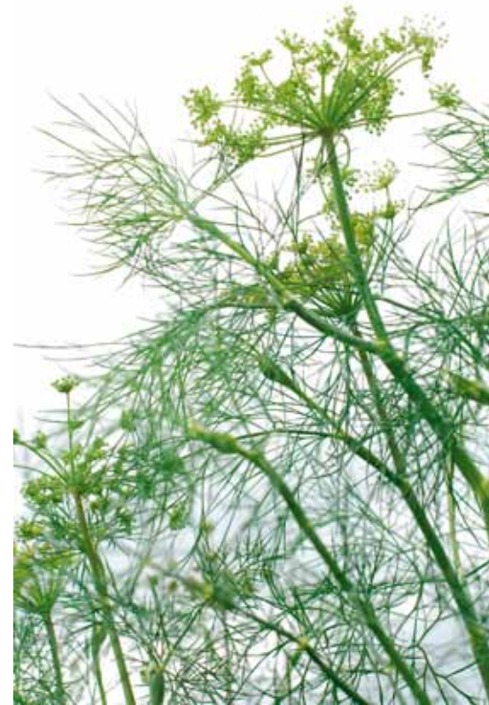
Dill (Anethum graveolens L.) och palsternacka (Pastinaca sativa L.) är arter som inte omfattas av utsädeslagstiftningen.