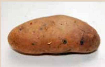
Mandelpotatisen från Lillhärjåbygget finns bevarad hos NordGen.