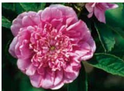
Kanelrosen 'Lövhult' blev utsedd till årets POM-ros 2010 och finns sedan dess att köpa i handeln.

En amatörsort får enbart säljas i små förpackningar och är menad att odlas av hobbyodlare. En amatörsort har inte några nationella begränsningar utan kan säljas inom hela EU. Syftet med amatörsorterna är att öka den odlade mångfalden i våra köksträdgårdar och att skapa ett större utbud av sorter som är anpassade till just din trädgård eller till andra speciella eller unika miljöer. Sorterna kan därför vara nyare sorter som är lite ovanliga men anpassade för särskilda förhållanden, men kan även vara äldre sorter.