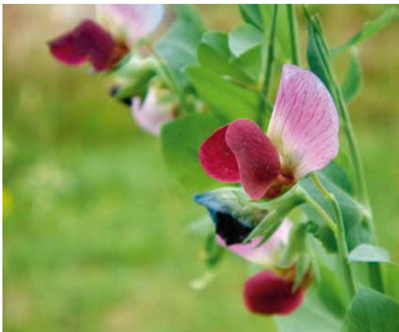
Blomma av gråärtssorten 'Rättvik', en bevarandesort sedan 2010.

Odling av utsäde till försäljning är reglerat i utsädeslagstiftningen, vilket bland annat innebär att sorten måste vara intagen på en officiell sortlista. Syftet med lagstiftningen är att köparen ska vara garanterad att få ett friskt och rent utsäde av sorter med kända egenskaper. Det har dock varit svårt för äldre och ovanliga sorter att tas in på sortlistan som en marknadssort. För att underlätta för dessa sorter att tas in på sortlistan finns det nu undantag i lagstiftningen för bevarandesorter och amatörsorter, vilket denna skrift handlar om.