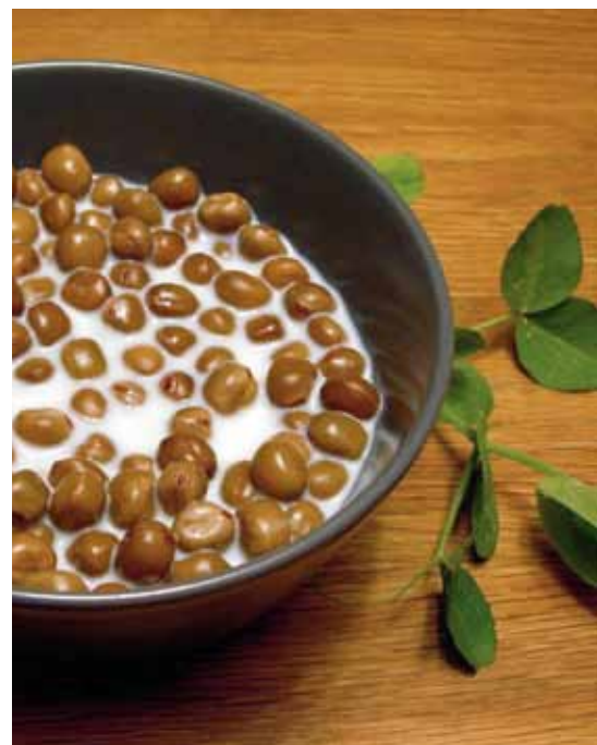
Kokta gråärter i mjölk är en traditionell maträtt från Bohuslän.