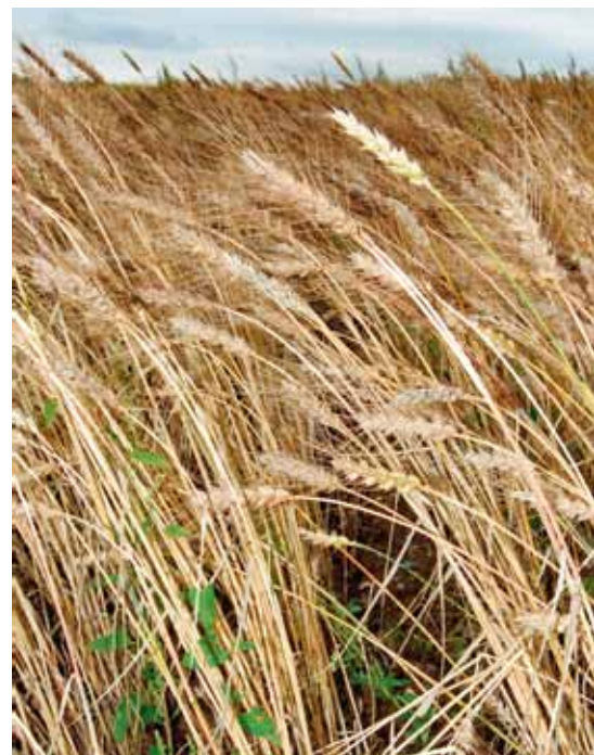
Vårvetesorten 'Fylgia I' var med på svenska sortlistan mellan åren 1933 och 1965. Från och med 2010 är sorten åter med på sortlistan, nu som en bevarandesort.