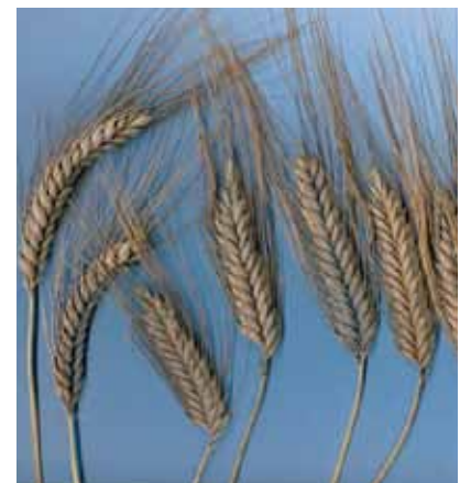
Svart emmervete (Triticum turgidum ssp. dicoccon (Schrank) Thell).

Innan du ansöker, se efter vilka arter som omfattas av utsädeslagstiftningen eller fråga Jordbruksverket. Det kan ju vara så att din sort inte behöver finnas på sortlistan för att du ska få sälja utsäde av den och då behöver du inte lämna någon ansökan om intagning på sortlistan eller följa reglerna för märkning och rapportering.