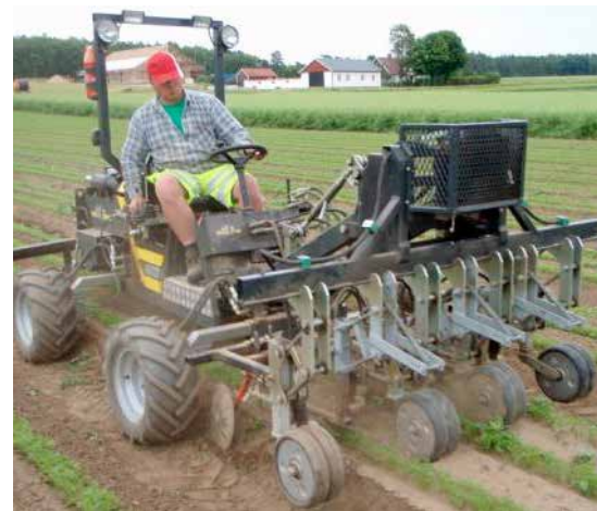
Redskapsbäraren Mac Trac kan användas för olika arbetsuppgifter. På bilden är den utrustad med roterande borstar.