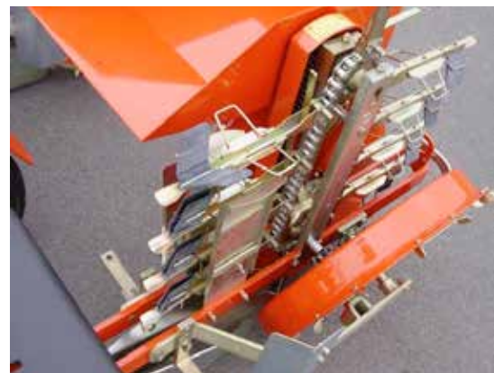
Mataranordning på Fox planteringsmaskin.

Planteringsmaskiner från italienska Ferrari säljs av Yding Smedie i Danmark. Ferraris maskinserie F-max klarar att plantera olika typer av plantor, till exempel pyramider, cylindrar och kuber. Plantorna laddas i en kopp på en roterande karusell. Varje karusell har åtta koppar vilket ger en kapacitet på upp till 3 500 plantor per timme och rad. Maskinen kan beställas för upp till åtta rader och för olika radavstånd. I standardutförande är radavståndet 50 cm. Plantavståndet är justerbart från 16 cm till 57 cm i steg om 2 cm. En enradig Ferrari F-max för torvkuber kostar cirka 37 000 kr fritt Danmark. Priset för tvåradig och tretradig maskin är cirka 57 000 kr respektive 75 000 kr.