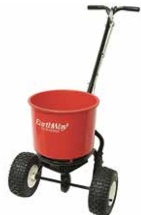
Med EarthWay Ev-n-Spred 2600 APlus kan man bredså grön gödselingsfrö och sprida gödning och sand på mindre ytor.