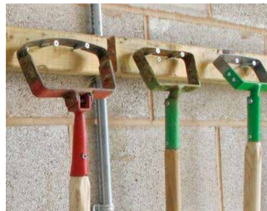
Med en pendelhacka kan man skyffla fram och tillbaka.