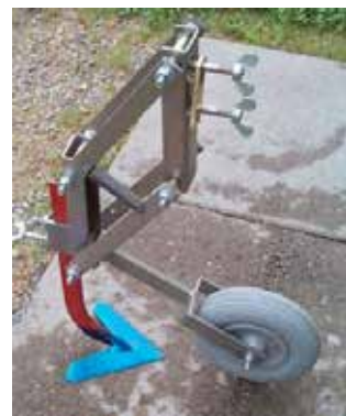
Gåsfotsskär till Weed Master redskapsbärare.

För den lite större odlingen används med fördel traktorburna radrensare. Om man vill använda en treradig radrensare måste man också så eller plantera tre rader i taget för att raderna ska bli parallella.