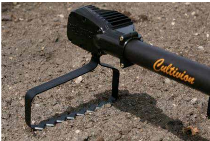
Eldriven motorhacka, Cultivion, som arbetar fram och tillbaka som en pendelhacka. Foto: Pellenc.

Det finns en elektrisk pendelhacka, Cultivion från företaget Pellenc i Frankrike, som kan användas till exempel i buskplanteringar. Enligt danska erfarenheter är den bra och effektiv men om man arbetar med den en hel dag kan det bli tröttsamt för armarna på grund av vibrationer. Cultivion kostar 18 400 kr inklusive batteri från Lotico och från Stads & Park Produkter.