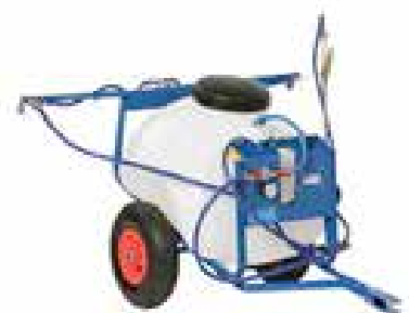
Spruta som kan bogseras efter fyrhjuling eller liten trädgårdstraktor.