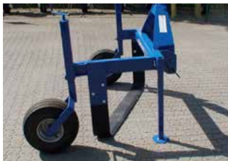
Lossare från Schrauwen för olika rotfrukter och potatis.