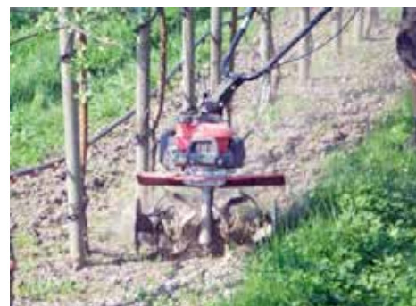
Motorhackor kan användas när marken är hård och ogräsen stora.