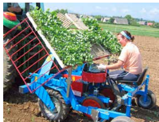
Planteringsmaskin TRG.