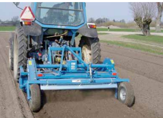
Fobro Kulti-Rotor 2000 fräser och lägger upp bäddar samtidigt.