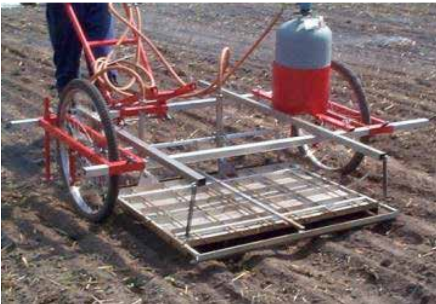
Redskapsbäraren Weed Master, här utrustad för bredflämning.

Som tillbehör till redskapsbäraren Weed Master, finns utrustning för bredflämning eller bandflämning. Aggregatet för bredflämning är 103 cm brett och används för flämning av hela bädden före grödans uppkomst. Det består av två eller tre brännare av fabrikatet Reinert. Varje brännare har en gasolförbrukning på 2 kg/h. Brännarna kan även monteras för selektiv flämning i raden. På ramen finns plats för en 11 kg gasolflaska. För radflämning används två 20 cm breda brännare per rad för flämning i raden före uppkomst eller mellan raderna efter uppkomst. Flämningsaggregatet kostar 10 300 kr med två brännare.