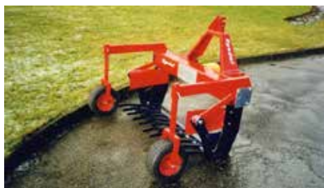
Lossare för rotfrukter.