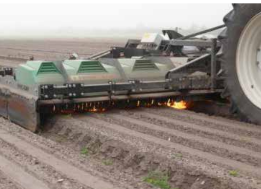
Envo-Dan flamaggregat för bredflamning i större odlingar.