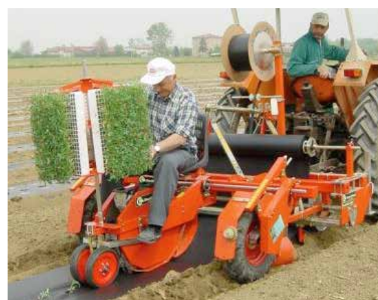
Wolf planteringsmaskin med roterande mataranordning.