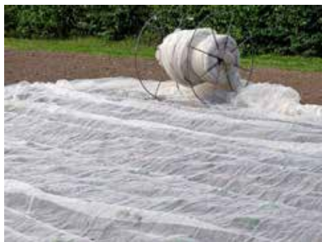
Enkelt hjul för att underlätta hanteringen av insektnät.