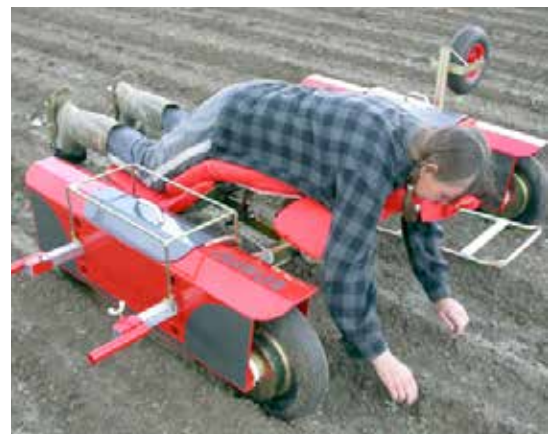
Crawler är en batteridrivna arbetsvagn från Elomestari som kan användas för ogräsrensning, plantering och skörd.

Drängen tillverkas och säljs av Maprosystem. Den kostar som basenhet 60 000 kr, fritt tillverkaren. Som tillbehör finns extra ligggenhet för cirka 8 900 kr och lådhållare för cirka 1 400 kr. Andra tillbehör är transportband, tak och hydrauldrivna borstar som styrs med händerna. Tillbehör för radrensning beskrivs i avsnittet Redskapsbärare.