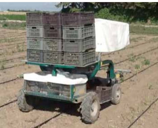
Sparrisördaren Bagioni Asp har plats för lådor baktill på flaket.