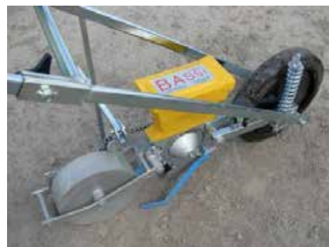
Bassi såmaskin SM Manuale för precisionssådd.