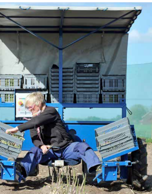
Skördeavagn för sparris, A.S. Green från Engels Machines.