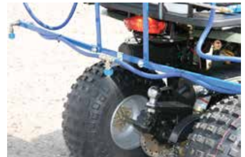
Sprutrustning att montera på fyrhjuling.