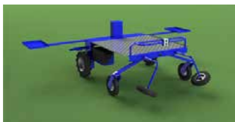
Elektrisk skördevagn med plats för många lådor.