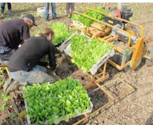
Självgående planteringsmaskin i Tyskland där sallatsplantorna planteras direkt i håll i marken som maskinen gör.