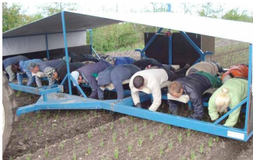
Traktordragen arbetsvagn från Yding Smedie som kan tillverkas med olika antal arbetsplatser. Ekippet på bilden har plats för 17 personer. Bild: Yding Smedie.

Maskinen fungerar för att rensa ogräs kortare stunder. Det går även att plantera sparrisplantor med maskinen. Det känns i kroppen när man suttit länge i samma ställning och arbetsställningen passar inte alla människor. Beroende på hur man vill ha skördelådorna placerade finns plats för 6–8 lådor. Soltak går att köpa som tillval. Engels Machines har ännu ingen återförsäljare i Sverige. Maskinen kostar cirka 41 000 kr från tillverkaren. Vid köp av enstaka maskin kostar frakten från Holland cirka 2 700 kr.