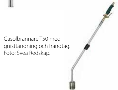
Gasolbrännare T50 med gnisttändning och handtag.