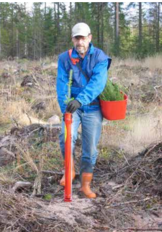
Planteringsrör som används för skogsplantor kan även användas för plantering av majs och andra grönsaker.