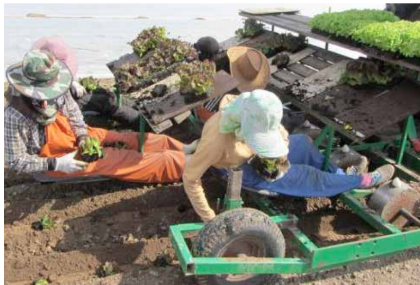
Hemmabyggt planteringsmaskin där sallatsplantorna sätts direkt i hålen som maskinen skapat. Arbetsställningen är inte den allra bästa.

Kapaciteten på dessa enkla maskiner är relativt låg. Vid sträckplantering kan man plantera 1500–2000 plantor per timme, men i praktiken blir kapaciteten lägre. För små företag där man bara planterar under en kortare tid kan en sådan maskin vara intressant, eftersom den klarar olika planttyper. Dessa enkla maskiner kan numera vara svåra att finna på markanden men det finns många hemmabyggen. Här visar vi några exempel.