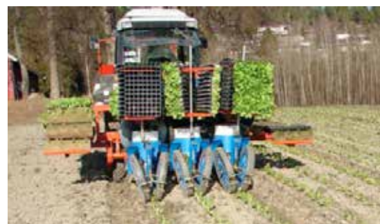
Planteringsmaskin från Ferrari.