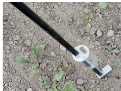
Sårör för sådd av majs och andra växtslag med stora frön.