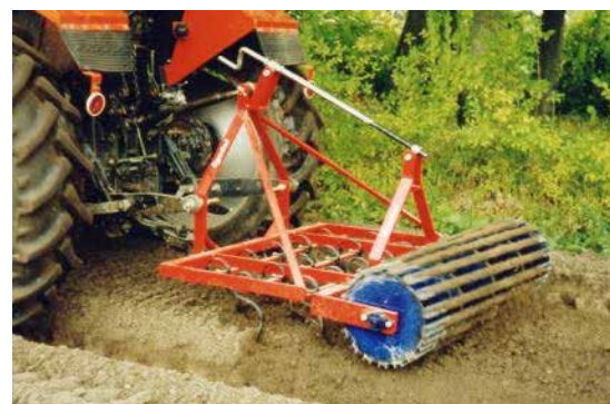
Bäddharv från Egedal. Det finns även redskap som återskapar på sidorna på bädden.