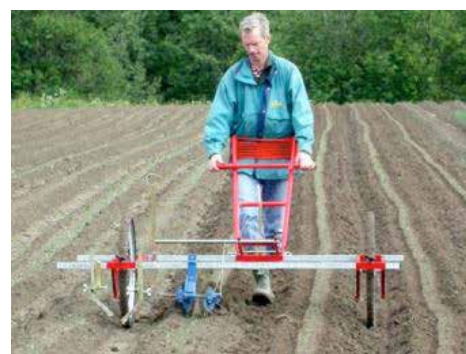
Tallriksskären kan användas till den första radrensningen för att inte hölja grödan.