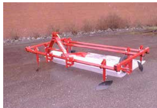
Väv/plastutläggare från Egedal.