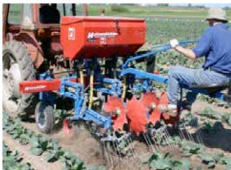
Radrensare med gåsfotsskär, skyddstallrikar, efterharvar och gödselspridare.