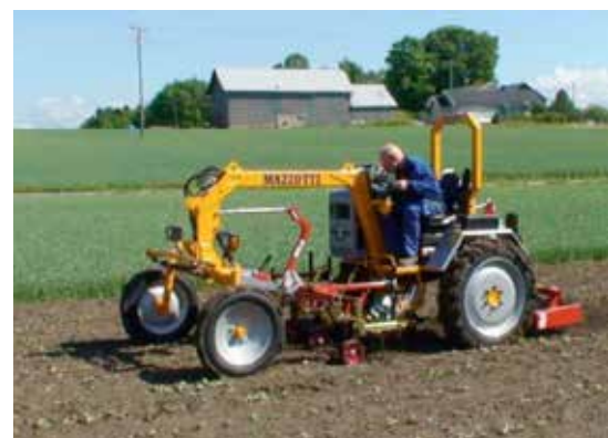
Mazzotti redskapsbärare.