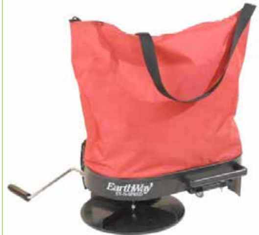
Med spridaren EarthWay Ev-n-Spred 2750 kan man bredså grön gödselingsfrö på mindre ytor.

Den hjulburna spridaren EarthWay Ev-n-Spred Flex Select har utbytbara tråg för att passa olika material. Trågen klarar 59 kg och finns i tre utföranden för olika storlekar på material. Standardtråget fungerar för olika typer av granulerade material. Spridaren är av centrifugaltyp och drivs då hjulaxeln roterar. Spridaren säljs av Weibulls Horto och kostar cirka 4 700 kr. I detta pris ingår ett standardtråg och ett valfritt extra tråg. Ytterligare extra tråg kostar cirka 850 kr. Spridaren kan enkelt konverteras till påhängsspridare med ett konverteringspaket som kostar cirka 1 150 kr.