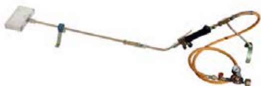
Handbrännare med stavbrännare