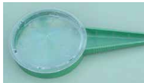
Med en handsådos kan man så mindre arealer.

Det finns 39 olika storlekar på fröutlopp fördelat på tre såskivor. Frö matas kontinuerligt och kan även släppas kontinuerligt vilket är lämpligt vid sådd av till exempel dill, gräslök och persilja. Maskinen klarar även gruppsådd då avståndet mellan såpunkterna kan ställas till 18, 27, 36 eller 54 cm. Sådjupet justeras med hjälp av en vingmutter på billen, till max 5 cm. Billens bredd är cirka 2 cm. En myllare för jord över fröna. En radmarkör medföljer. Höjden på handtaget är justerbart. Bonifacy tillverkas i Tyskland och säljs i Sverige av Olssons frö för cirka 2 000 kr. Även danska Ukrudtshajen och tyska K.U.L.T. säljer en liknande såmaskin.