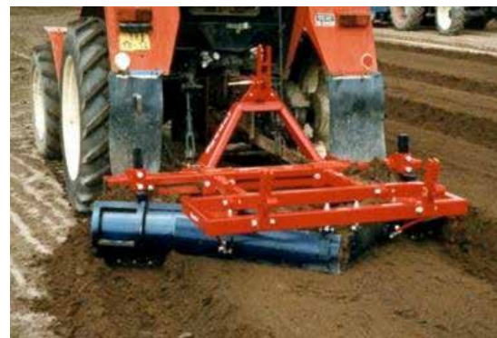
Egedal bäddläggare skapar bäddar på bearbetad jord.

Det finns en förhållandevis enkel utläggare för väv eller plast på bädd från Egedal. Redskapet går att anpassa för olika bäddbredder med en maximal arbetsbredd på 180 cm. Som extrautrustning kan man köpa insamlare. En maskin med arbetsbredden 180 cm kostar cirka 35 000 kr fritt Danmark.