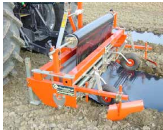
Plastic-Stop lägger ut plast på plan mark eller bäddar.