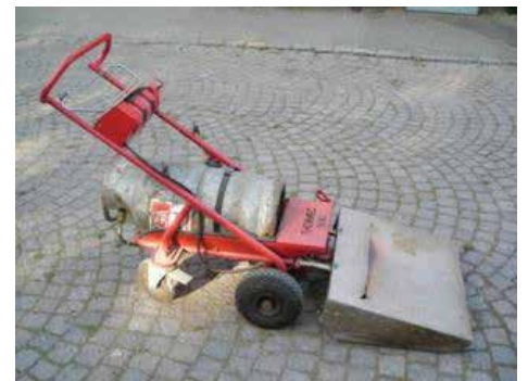
Exempel på flammare för hårdgjorda ytor, som med modifierad hjulutrustning skulle kunna användas i grönsaksodling före grödans uppkomst.