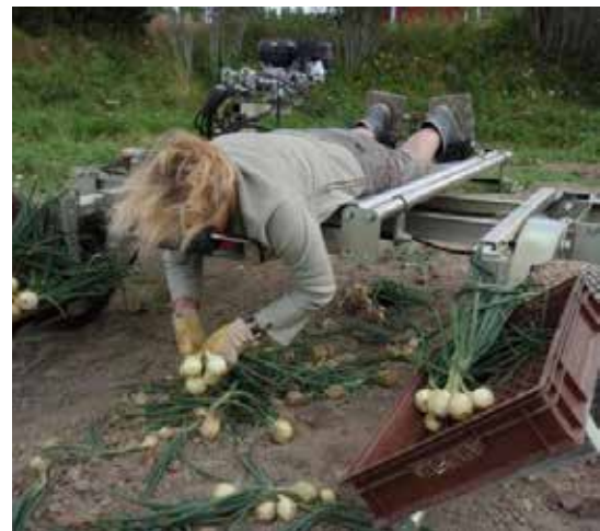
Arbetsvagnen Drängen kan användas till ogräsrensning, plantering och skörd.