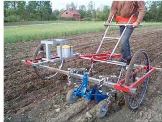
Weed Master är en skjutbar redskapsbärare som kan användas med olika redskap. På bilden visas den med tallrikshacka och med elektrisk hjälpmotor.

Det finns ytterligare redskapsbärare med ungefär samma möjligheter och tillbehör från Egedal och andra leverantörer.