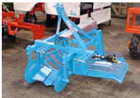
Enradig lossare från Spedo för potatis.