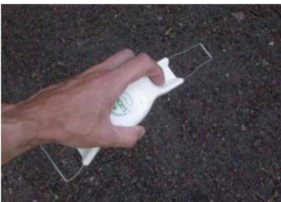
Handredskapet Lucko underlättar vid handrensning och gallring.

Lucko består av ett formgjutet plasthandtag med två 2 mm tjocka trådbyglar av rostfritt stål, 65 mm och 25 mm breda. Redskapet kan underlätta arbetet med gallring och ogrärensning i raden. Lucko tillverkas av Peje-Plast och säljs av Svea Redskap, Lindbloms Frö, med flera. Den kostar cirka 60 kr.