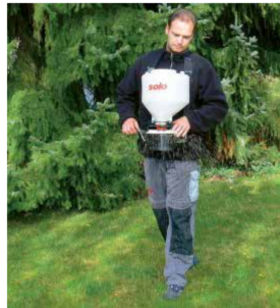
Spridaren Solo 421 kan användas för spridning av frö, gödsel och kalk.