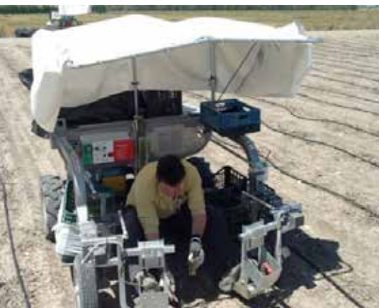
Bagioni Asp är en batteridrivna maskin för skörd av sparris.