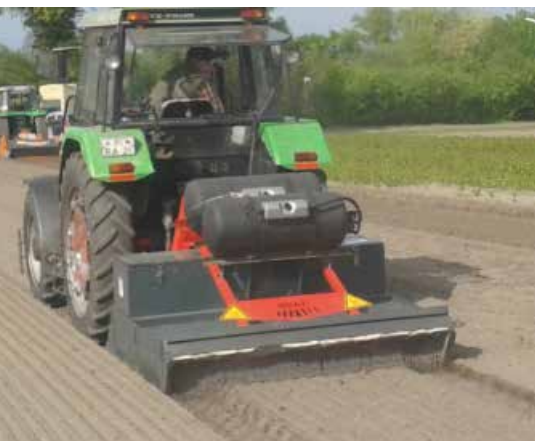
Hoaf KB 1.8 för flamning i bäddodling.