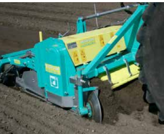
Bäddläggaren Ortiflor-Stones är anpassad till steniga jordar.