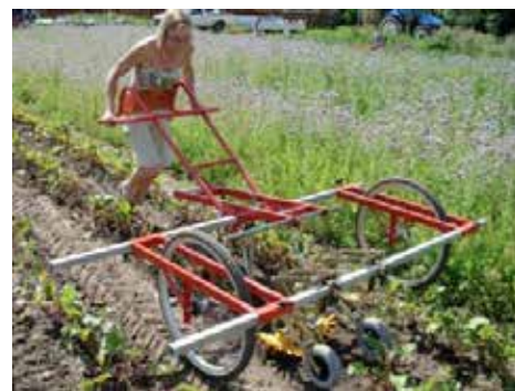
Små fingerhjul kan monteras på redskapsbäraren Weed Master för ogräsbekämpning i raden.