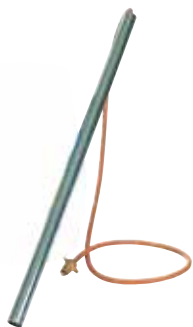
Ogräsbrännaren Trädgårdsdraken har tillräcklig effekt för att fungera i yrkesodlingar.

Flamningens intensitet anpassas främst med framföringshastigheten och avgörs till stor del av ogräsens storlek och av väderleken.