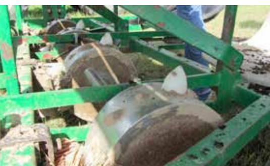
Hemmabyggt planteringsmaskin som trycker håll i jorden där plantorna sätts ner.