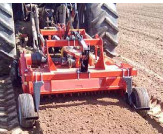
Foriga bäddfräs fräser och formar bädden i samma arbetsmoment.