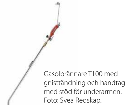
Gasolbrännare T100 med gnisttändning och handtag med stöd för underarmen.

Envo-Dan i Danmark har en liknande flammare för hårdgjorda ytor med arbetsbredd 60 cm och gasolförbrukning 4,2 kg/h.