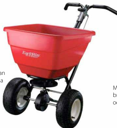
Med EarthWay Ev-n-Spred Flex Select kan man bredså grön gödselingsfrö och sprida gödning och sand på mindre ytor. Spridaren kan konverteras till påhängsspridare.