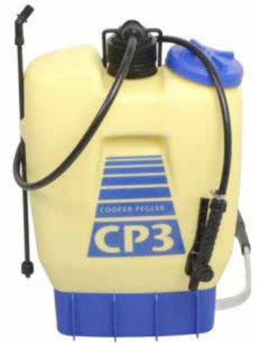
Ryggsprutor och handsprutor kan användas för biologiska bekämpningsmedel och andra växtskyddsmedel.

Det finns skyddsföreskrifter för växtskyddsmedel. Läs förpackningens etikett noga. Mer information om säkert växtskydd finns på www.sakertvaxtskydd.se och på Jordbruksverkets webbplats www.jordbruksverket.se , klicka på > Odling > Växtskydd.