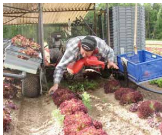
Drängen kan kompletteras med tak och flera hållare för lådor.