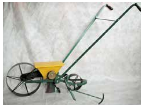
Bonifacy såmaskin.