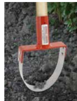
Med bygelhacka med runt skär kan man enklare komma djupare ner i jorden på lite styvare jordar.