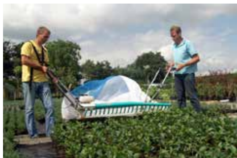
Skördemaskinen EazyCut från det japanska företaget Ochiai för skörd av örter och småblad.