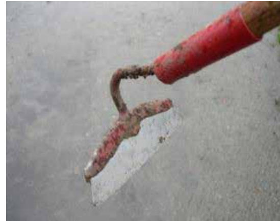
Den vanliga renshackan används mot både små och stora ogräs.

Med en bygelhacka är det enkelt att hacka bort ogräs i raden utan att skada kulturväxten.