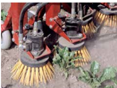
Borstar för ogräsbekämpning nära och i raden.

Radrensare har ofta gåsfotsskär som standard, men man kan också använda tallrikskär, stjärnhjul och borstar som bearbetningsorgan. En potatiskupare är användbar om man odlar grönsaker på potatisdrillar. Med dessa redskap kan man med olika inställningar bearbeta jorden mellan raderna och kupa jord in i raderna för att täcka små ogräs.