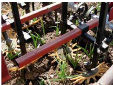
Fingerhjul mot ogräs i raderna i vitlök.