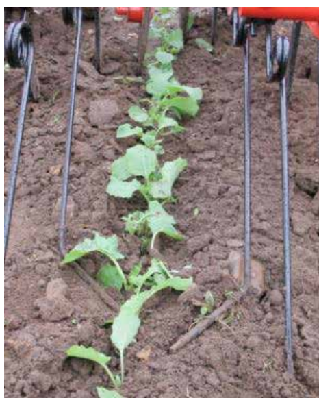
Efterharv och skrappinnar finns som tillbehör till Einböck radrensare.