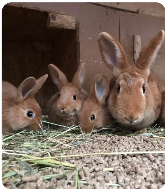
Kaninhona med kull äter kraftfoder

sammans med en hane. Om du väljer parning i grupp bör hanen stanna hos honorna i 15–20 dagar för att sedan tas därifrån. Du bör också kunna separera honorna och sätta dem enskilt under den sista dräktighetsveckan, och det är viktigt att hon har tillgång till egen bolåda och bomaterial under denna tid. De tre sista dygnen under honans fyra-veckors dräktighet börjar hon bygga ett bo av halm eller annat långsträigt material. Honan fodrar sedan boet med underull som hon rycker från sin buk, detta gör hon ofta alldeles inpå födseln. Ungarna föds i pälsboet, nakna och blinda, och stannar där tills de är två till tre veckor gamla. Honan öppnar boet när hon anser att ungarerna kan komma ut, men även för att reglera värmen för ungarerna. Under tiden ungarerna är i boet diar de en till två gånger per dygn.