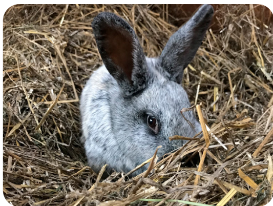
Kanin bäddar i halm

fullt ut. Men redan efter ett år kan ditt egenproducerade foder, så kallat omställningsfoder, användas till dina djur under omställning. Under hela omställningstiden ska du hålla dina kaniner enligt reglerna för ekologisk produktion. Har du redan ekologisk mark, och kanske även annan ekologisk djurhållning, går det såklart fortare att certifiera kaninproduktionen, eftersom marken då redan är klar.