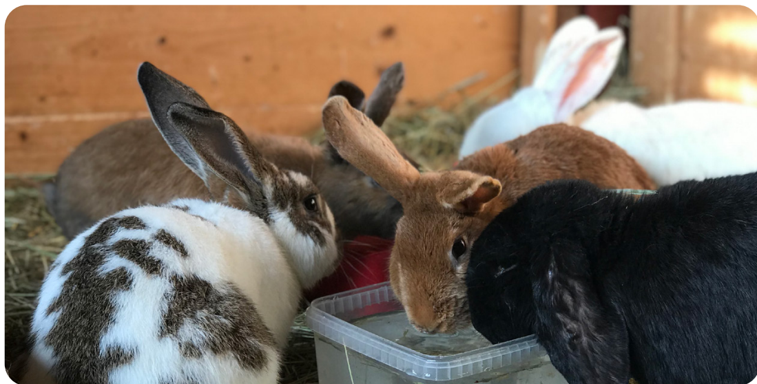
Ungdjur i grupp

Kaninhonan blir könsmogen och kan paras första gången från fem månaders ålder. Hannar är något senare i sin mentala mognad och bör vänta någon månad innan de går i avel. Parning kan ske enskilt med en hona tillsammans med en hane, eller i grupp där flera honor går till-