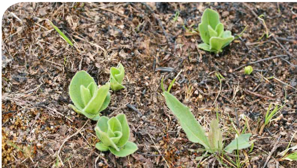
Småplantor av slåttergubbe och andra fibblor tittar fram i det brända gräset.

Att bränna för att bättra på betet i markerna är en kunskap som generationer av bönder har använt. Och genom att fläckvis bränna gräs och örter, tidigt om våren, kan markerna hållas i god hävd. En hävd som ger områden med örter möjlighet att blomma under sommaren eller att få partier där tjockt fjolårsgräs ligger som en filt att åter bli till örtrika gräsmarker. Vissa marker - eller delar av dem, med många blommande örter kan kanske betesfredas och sparas för pollenoch nektarbesökande insekter – för att sedan brännas nästkommande vår. Rätt använd och med eftertanke kan småskalig naturvårdsbränning öka mångfalden i våra gräsmarker.