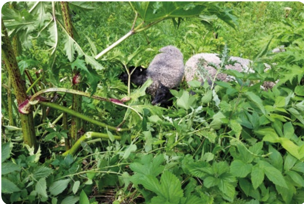
Gotlandsfår mår väl av att beta jätteloka.

Jönköpings kommun hyr in ett femtontal Gunnerydstackor för att beta bort den invasiva arten jätteloka på ett bete på andra sidan av Vättern. Djuren reagerar inte alls på den giftiga saften från lokan. Fåren har många besökare och grannarna tycker det är roligt att det finns djur i hagarna. Vi har tecknat ett skötselavtal där kommunen står för stängelskostnaden och vi ansvarar för djurskötseln. Vi tar betalt för resekostnaderna för tillsyn och djurtransport.