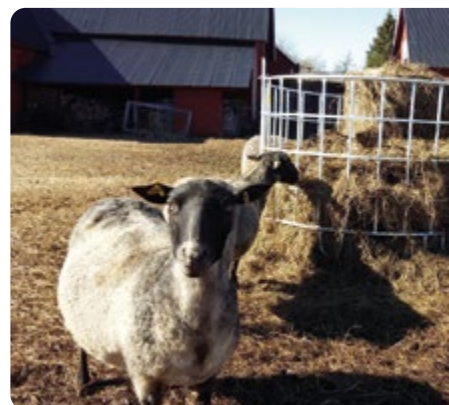
Vid utfodring utomhus ska djuren ha fri tillgång till foder så att de aldrig letar efter något att äta i det smutsiga foderspillet på marken.

Det gäller att få ut djuren på bete så tidigt som möjligt på våren, annars förväxer betet. Vi strävar efter att betet ska vara mellan 4 och 10 cm långt hela tiden men det är svårt att leva upp till det eftersom stora delar av naturbetena inte går att putsa eller skörda utan lätt blir förvuxna. Med lång betessäsong blir naturbetena ändå väl avbetade. Lammens tillväxt blir lidande under framför allt juli månad. Detta kompenseras efter frånskiljningen runt 23 juli då lammen flyttas till vallåterväxt och börjar utfodras med små givor kraftfoder. Tackorna får gå kvar på naturbete.