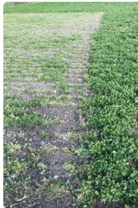
På bilden syns en första avbetning av rödklövervall i början av maj. Tackorna har betat i 4 dagar till vänster i bild och nu flyttats vidare. Det är viktigt med snabb avbetning och att de tas bort i tid.

Lammen vägs ofta och målet är att slakta lammen vid cirka 100 dagars ålder och vid en vikt på 41 till 46 kilo, vilket på grund av det höga slaktutbytet ger en slaktvikt på 21 till 24 kilo. Lammen klassar sig oftast i U eller R.