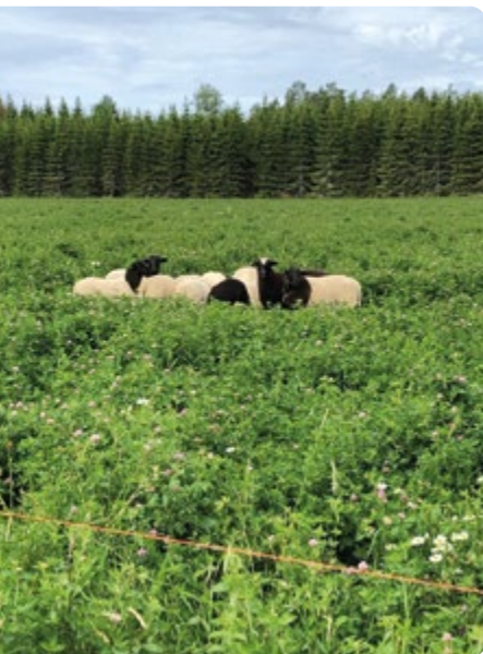
Sista slaktlammen på rödklöverfrövall i början av juli.

Tackorna flyttas från rödklövervallarna vid avvänjning, men lammen går kvar fram till slakt som brukar ske senast i mitten av juli. Efter att lammen är avvanda går tackorna dels på återväxtbete och dels på naturbetesmarker. Efter tröskning betar tackorna ofta insådder, bland annat de som året efter ska användas till grisbete. Tackorna går på bra bete hela hösten till slutet av oktober. Tackorna gör också här ett bra jobb och håller efter ogräs. Tackorna betar också mellangrödor efter tröskning, bland annat blodklöver som sås med i spannmålen, eller raps som betas i stubben.