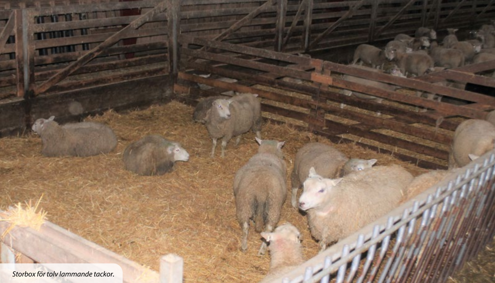
Storbox för tolv lammande tackor.