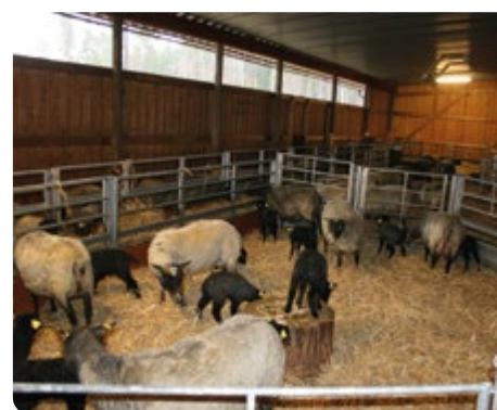
Vid lamning boxas tackorna i enskilda lamningsboxar som skymtar längst bort på bild. Därefter släpps tackor med lamm ut i en fälla skild från de olammade tackorna. På andra sidan foderbordet skymtas högdräktiga tackor vars utrymme minskar i takt med att antalet lammade tackor ökar.