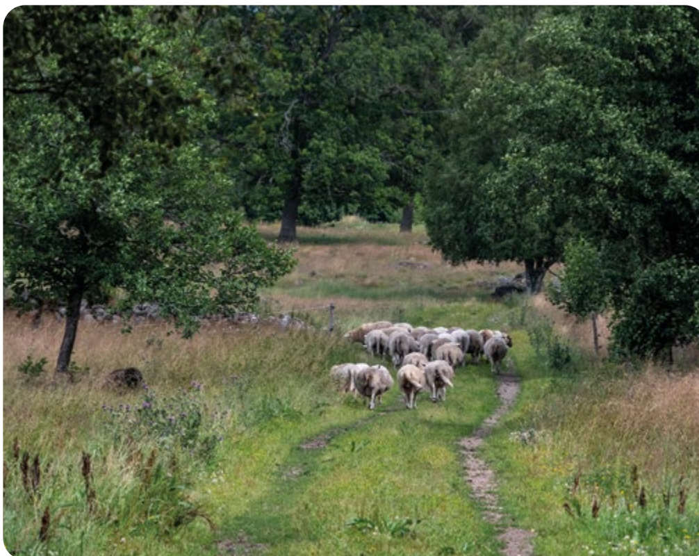
Får på naturbete.

För att få bra ekonomi i produktionen är det angeläget att få så bra betalt som möjligt för utslagstackor och då måste de ha rätt form- och fettklass när de går till slakt. I dagsläget får man 400 kronor i genomsnitt för en utslagstacka. Priset behöver vara mycket högre för två- och treåriga utslagstackor eftersom det finns konsumenter som anser att köttet är av mycket hög kvalitet. Vad som krävs är att producentföreningar, slakterinäringen och handeln anstränger sig och visar ett större intresse för att skapa avsättning för kött från unga tackor.