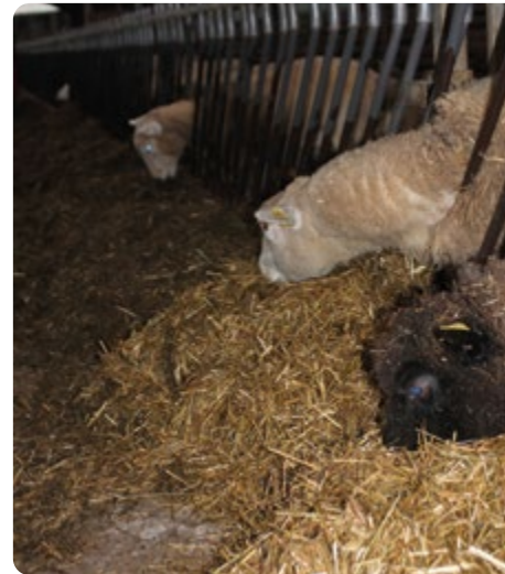
Mix till lågdräktig/sint tacka. Lågt näringsinnehåll per kilo torrsbstans, stor mängd struktur för att minska konsumtionen.