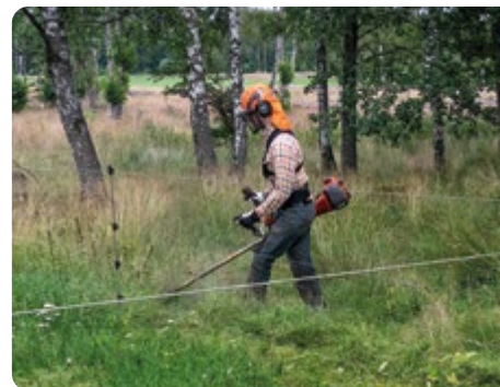
Putsning under elstängsel.

Tackor och lamm tas in från bete två gånger för vägning, vid 60 och 110 dagars ålder. Vid 110 dagar avvänjs lammen oavsett vikt. Som regel tas ett av trefödda lamm ifrån tackan för att födas upp som flasklamm. Här väljs lamm så att tackan får behålla två så jämnstora lamm som möjligt. Det blir cirka 20-25 flasklamm årligen.