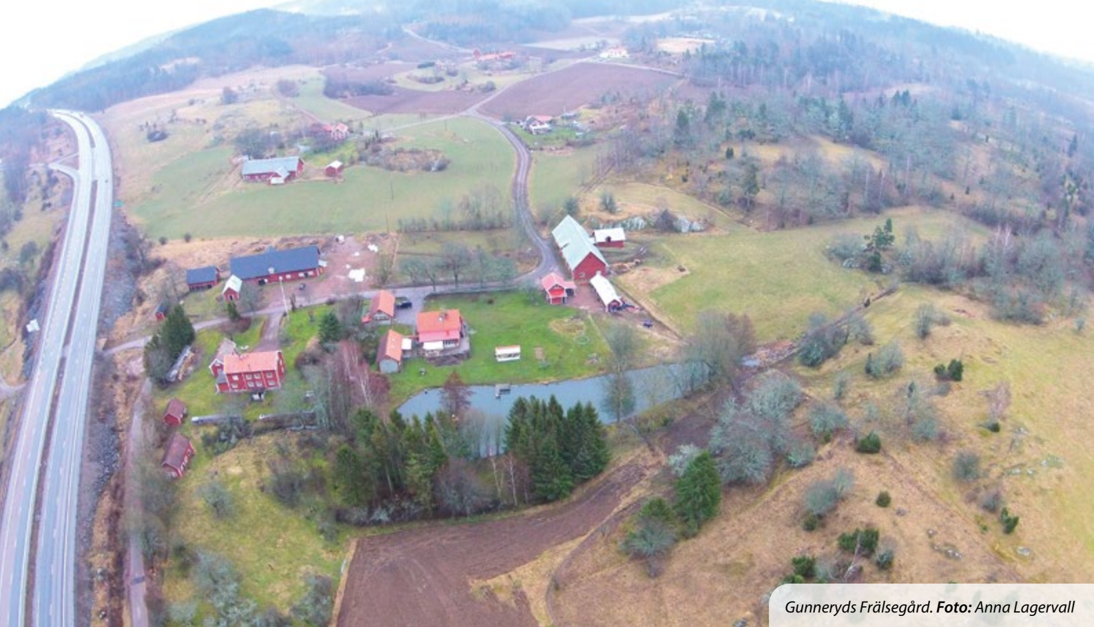
Gunneryds Fräsegård.