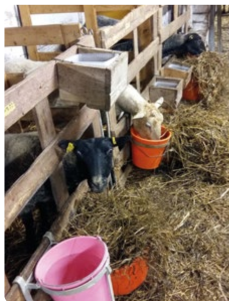
Tackorna matas och vattnas utanför lamningsboxarna. Det spar både tid och arbetskraft.