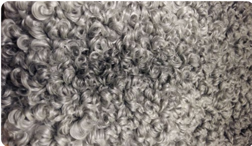
Skinn från gotlandsfår.

Förutom kött säljs också skinn från gården. De ger en intäkt på drygt 850 kronor per slaktlamm när återtagskostnad, beredningskostnad och 15 procent trasiga skinn räknas bort. Totala intäkten per lamm blir cirka 1500 kronor för kött och skinn.