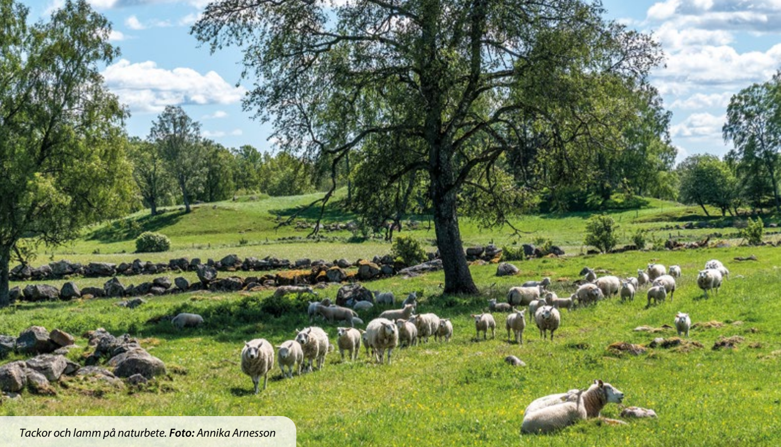
Tackor och lamm på naturbete.