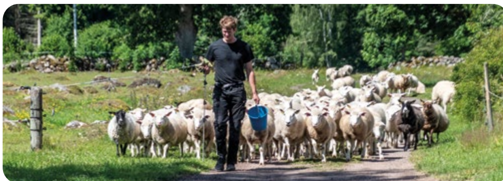
Lammen tas hem för avskiljning.