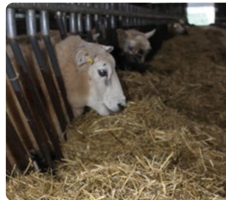
Mix till betäckningstacka. Framförallt högre energiinnehåll, flusching skall påverka scanningresultatet positivt.