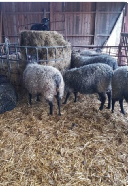
Tidigare användes rundbalshäckar för utfodring.