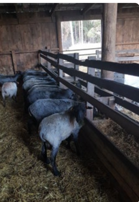
Ungbaggar som ska slutuppfödats till slakt på fullfoderblandning.