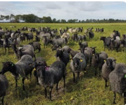
Tackor och lamm på bete.

riksdomare, så det märks att avelsarbetet har varit en röd linje i besättningen. Många fina livdjur har sålts under årens lopp och baggar till semin har även tagits ut.