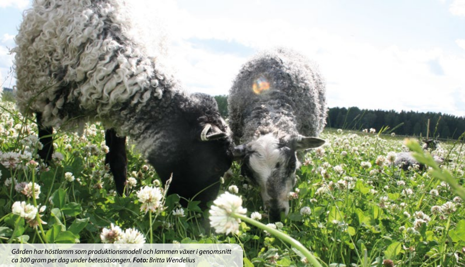
Gården har höstlamm som produktionsmodell och lammen växer i genomsnitt ca 300 gram per dag under betessäsongen.