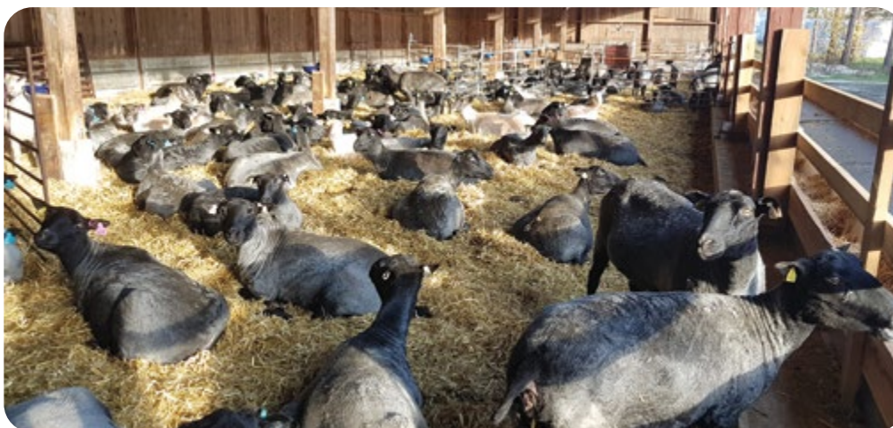
Nyklippta tackor inför betäckningen.