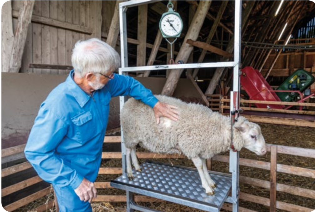
Mönstring av finullstacklamm.

som är den stora rasen i besättningen, hålls tre stora betäckningsgrupper och fyra till fem små, med sju till tio baggar totalt. För de nya raserna dorset och finull i besättningen hålls till en början tre till fyra dorsetbaggar och en till två finullsbaggar. Genom att ha många betäckningsgrupper kan även egenuppfödda baggar användas till avel i besättningen.