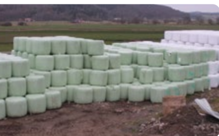
Ordning på foderpartierna så rätt mix kan göras till de olika produktionsstadierna.

tillsammans med rådgivare tidigt på hösten. Löpande under utfodringsåret justeras mixarna efter utfallet på djuren.