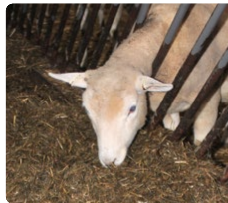
Mix till lamm. Spätt gräs med högt näringsinnehåll och hög smaklighet, lägre mängd struktur för en så hög konsumtion som möjligt.