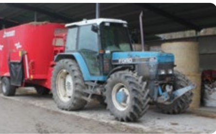
Mixervagnen ett viktigt verktyg för att förädla fodret till fina väl växande lamm.