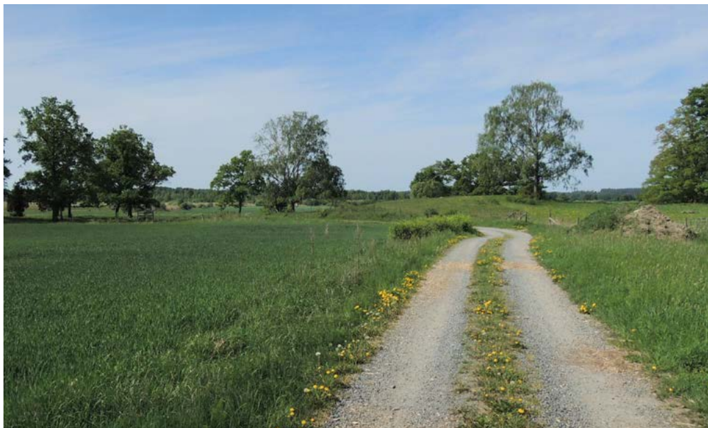
Ortolansparven trivs i betesmarker i direkt anslutning till åkermark.