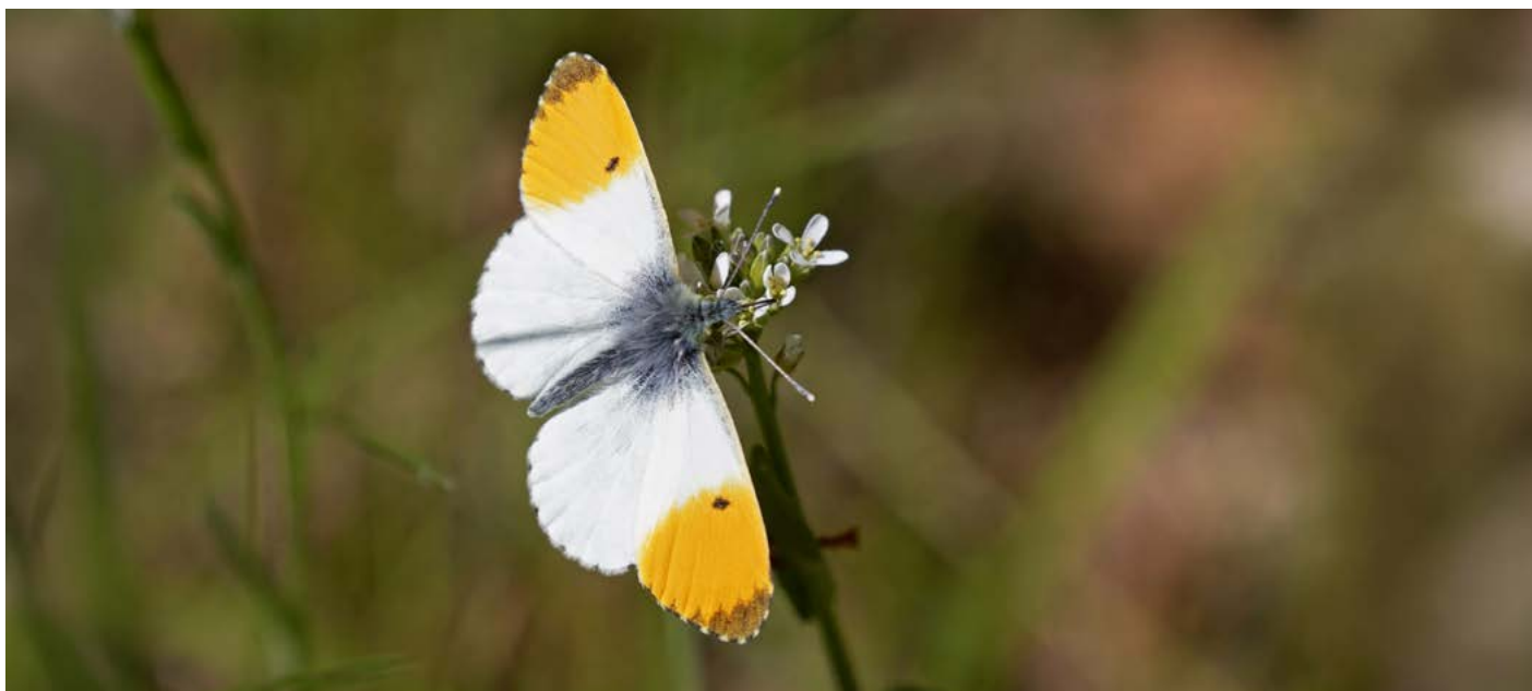
Aurorafjärilens hane ser ut att ha doppat vingpetsarna i orange färg. På latin heter aurorafjärilen Antocharis cardamines .