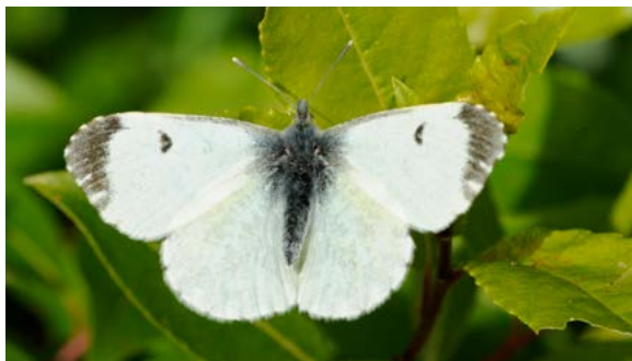
Honan saknar orange vingpetsar.

Aurorafjärilens hane är lätt att känna igen eftersom vingpetsarna ser ut att vara doppade i en orange färg. Detta har också gett arten dess engelska namn, Orange-tip. I den grekiska mytologin heter morgonrodnadens gudinna Aurora och aurorafjärilens orange vingpetsar kan föra tankarna till en rodnande soluppgång. Aurorafjärilens hane är en mycket ihärdig fjäril som flyger över stora områden, till synes utan att tröttna.