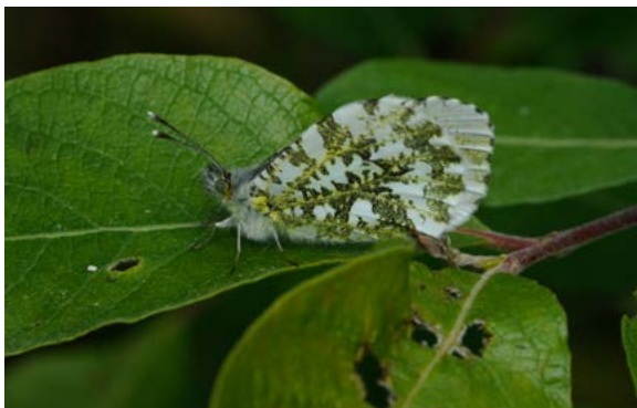
Vingundersidan är marmorerad hos både hanen och honan.