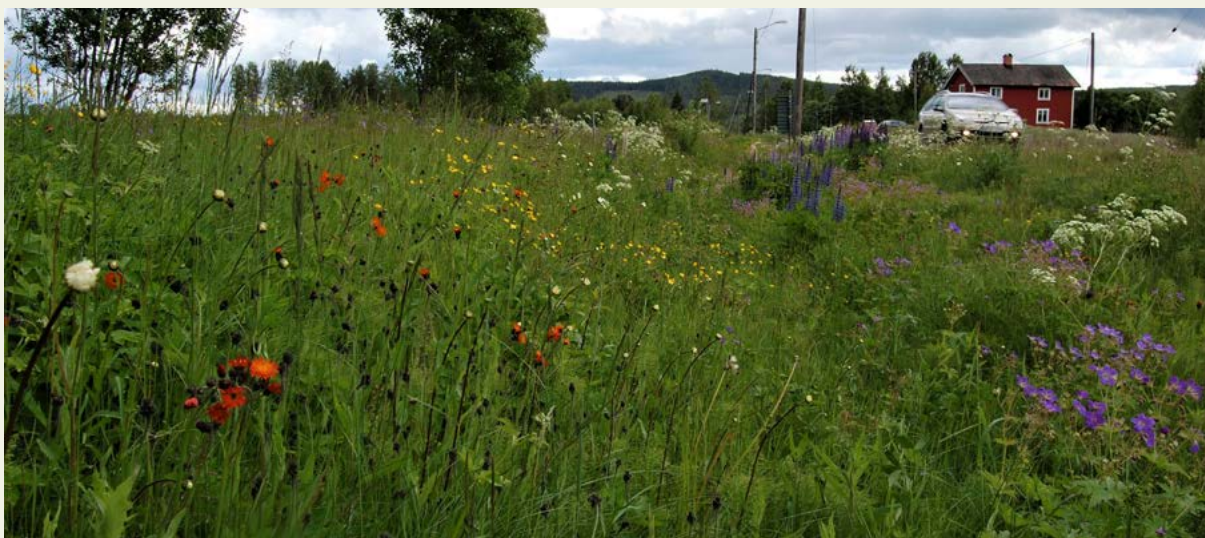
Slå vägkanter vartannat år så att endast en sida blommar åt gången.