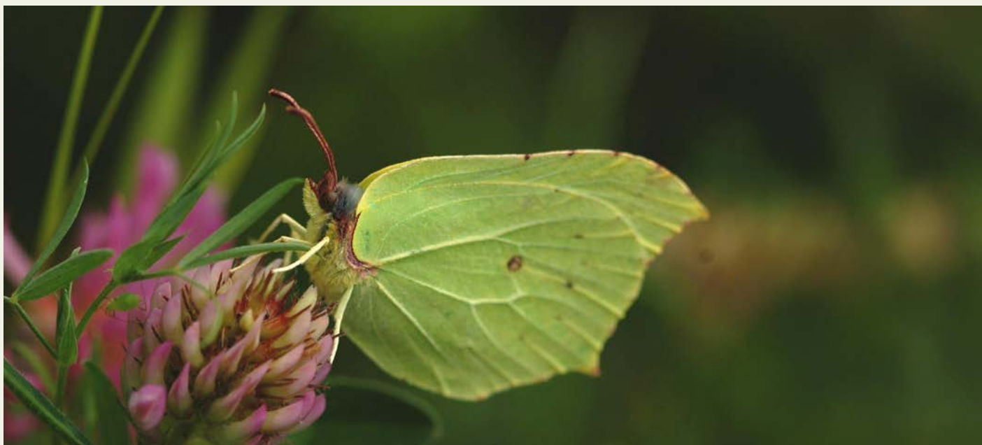
Blommande klöver gynnar citronfjärilen. På latin heter citronfjäril Gonepteryx rhamni .