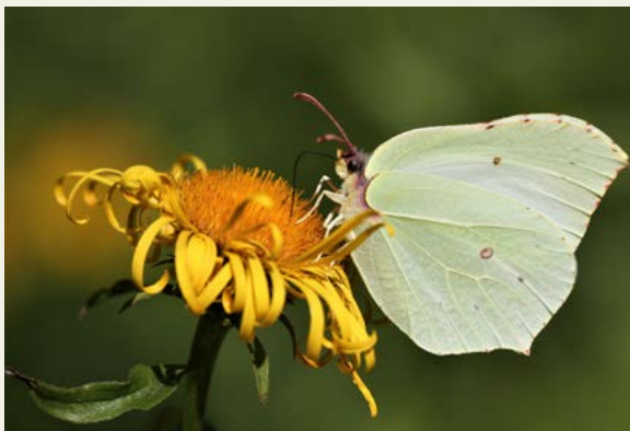
Citronfjärilshonan är ljus limegrön.

Tiden från äggläggning till fullbildad fjäril är knappt två månader. Nykläckta fjärilar ses i juli och augusti. De letar efter föda på sensommarens nektarväxter och letar sedan upp en bra övervintringsplats i september. Citronfjärilen är vår mest långlivade fjäril. Enstaka fjärilar kan leva upp till ett år, från juli till maj eller juni året därpå.