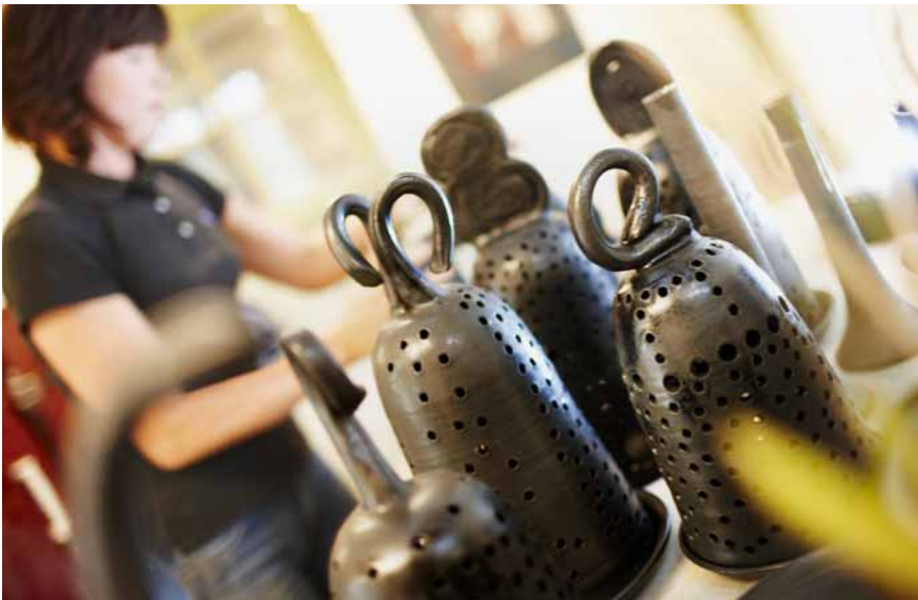
Condesign Communications 2009-09

Landsbygdsnätverket når du genom tfn 036-15 50 00 eller via www.landsbygdsnätverket.se .