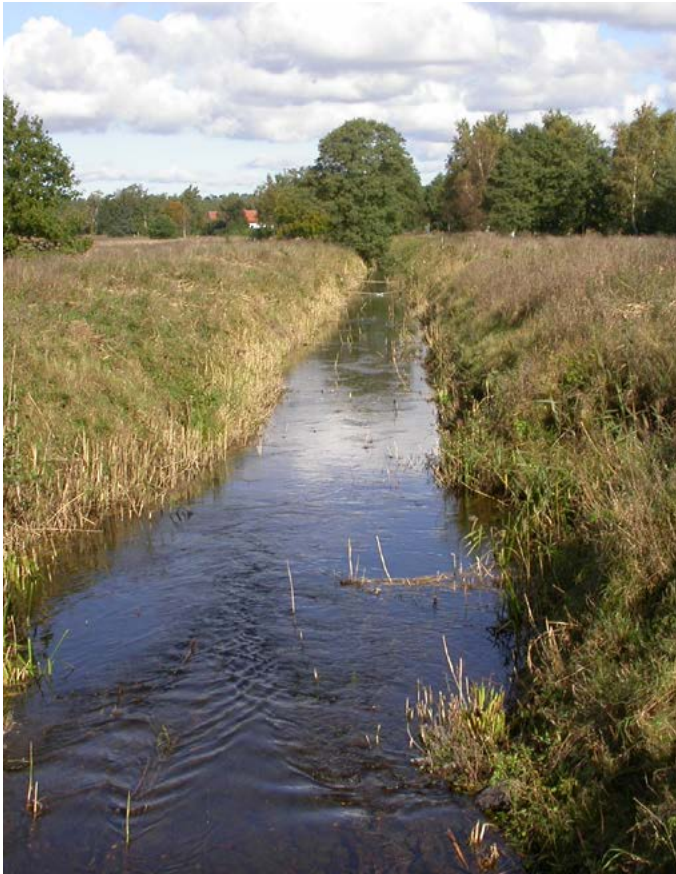
Högst halt av DFF uppmäts under senare delen av hösten, då också flest bekämpningar görs.

Säkert växtskydd startade en kampanj 2018. Den går ut på att påverka lantbrukare att genom ändrat beteende minska förekomsten i vattendrag av diflufenikan (DFF), ett verksamt ämne i flera ogräsmedel. Genom fältvandringar, rådgivning, ogräsbrev och faktablad har vi informerat och debatterat. Nu är det dags för en uppföljning!